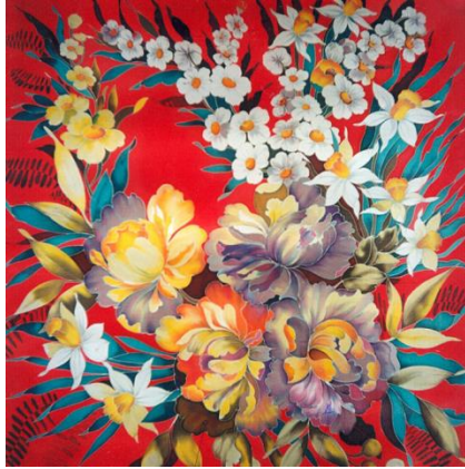
Заявка на ГУ №2020769419 Троицкий платок (г. Троицк (Москва))