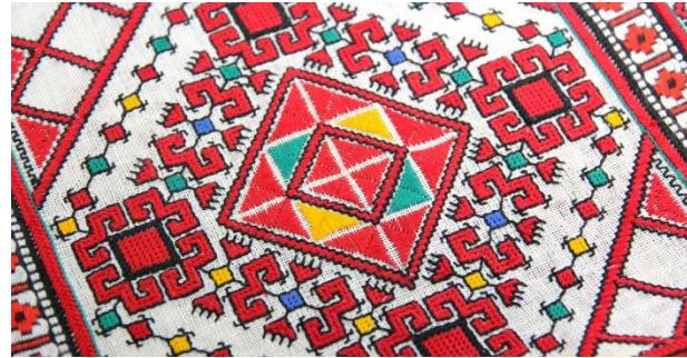
Чувашская вышивка (Республика Чувашия)