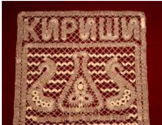
Заявка на НМПТ №2020743798 Киришское (захожское) кружево (Ленинградская область)