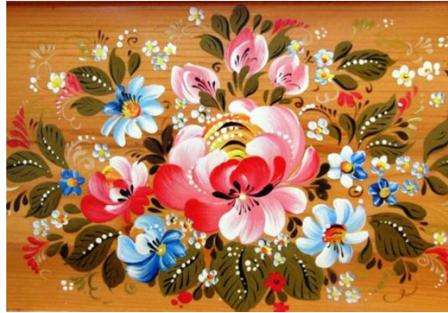
Заявка на НМПТ №2020764958 Волховская роспись (Ленинградская область)