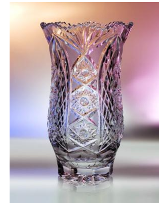
Дятьковский хрусталь (Брянская область)