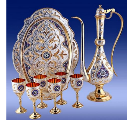
Кубачи (Республика Дагестан)