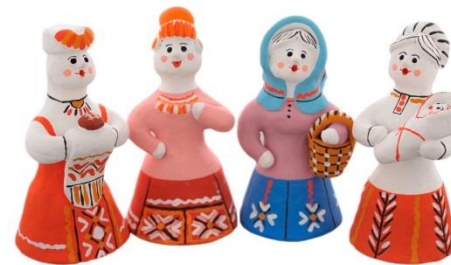
Каргопольская глиняная игрушка (Архангельская область)