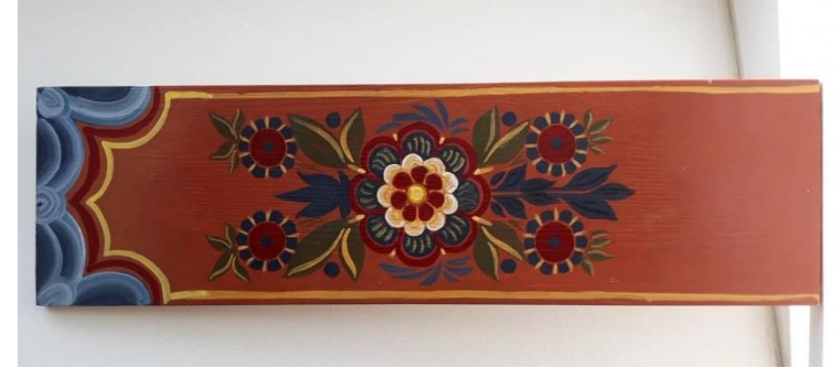
Заявка на НМПТ № 2020764959 Шугозерская роспись (Ленинградская область )