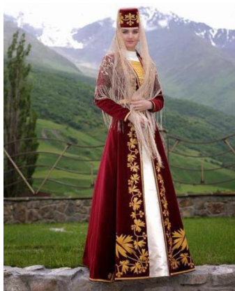
Национальные осетинские костюмы (Республика Северная Осетия - Алания)