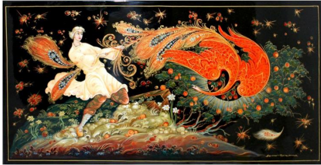
Палех (Ивановская область)