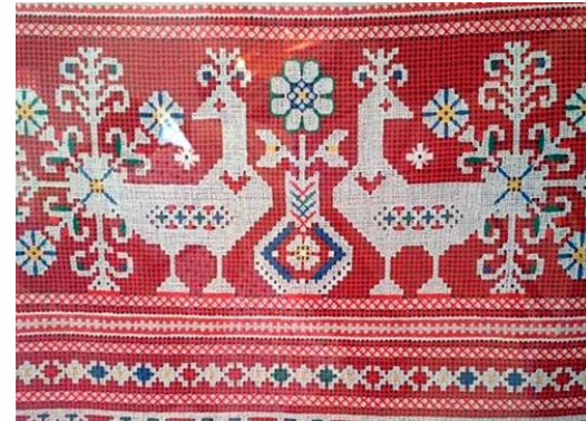
Заявка на НМПТ №2020715232 Тарусская вышивка (Калужская область)