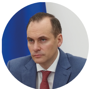
А.А. Здунов Глава Республики Мордовия

Лидерство будет за теми, кто владеет наиболее качественной и объективной информацией и умеет применять её для развития экономики государства, региона и отдельной компании!