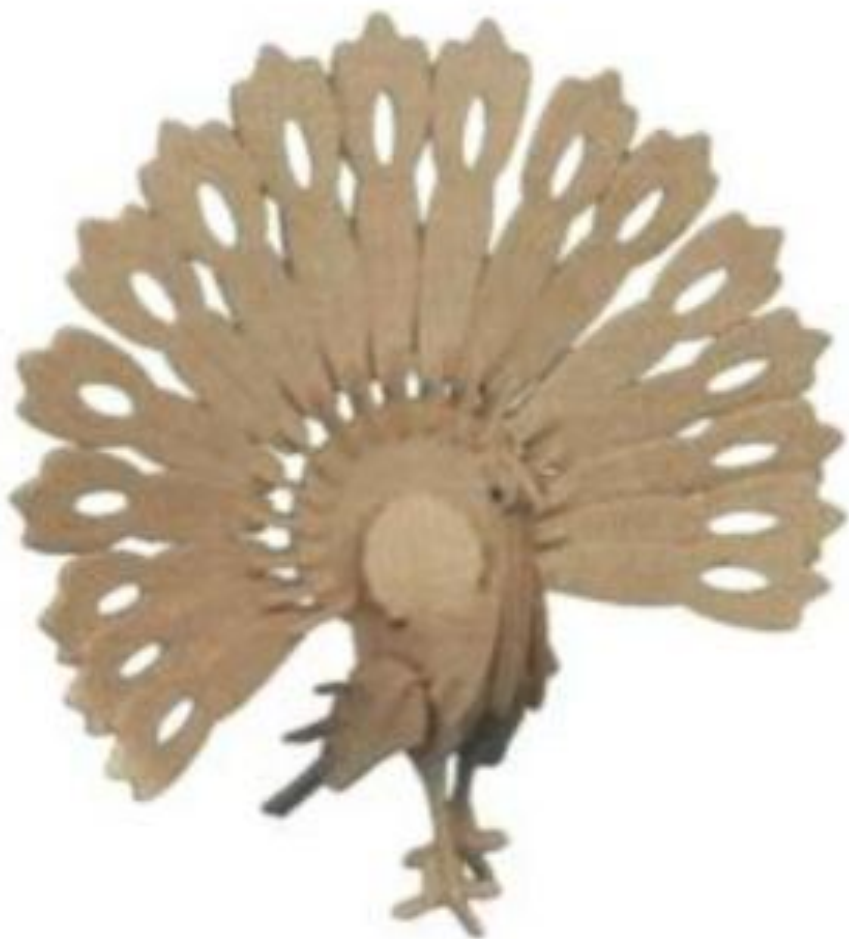
Заявка № 2016713797

«Судебная коллегия отмечает, что в судебном заседании представитель Роспатента не отрицал, что заявленное на регистрацию объемное обозначение обладает оригинальностью. Учитывая данное обстоятельство судебная коллегия считает необходимым констатировать: вывод оспариваемого решения о том, что форма изделия (игрушки "Павлин") обусловлена исключительно его функциональным назначением, а также последующий вывод об отсутствии у заявленного обозначения в связи с этим различительной способности не может быть признан обоснованным»